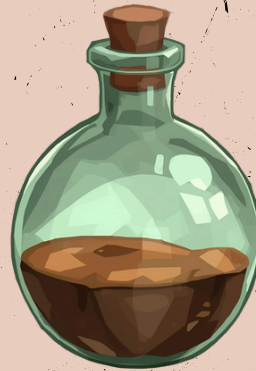
FLASCHE MIT HARZ