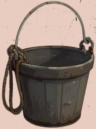
EIMER MIT SEIL