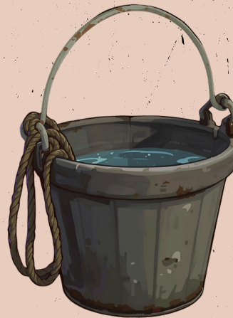
EIMER MIT WASSER