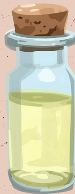
PIOLE MIT ZITRONENSAFT