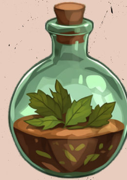
FLASCHE MIT HARZ UND GETROCKENTEM SALBEI